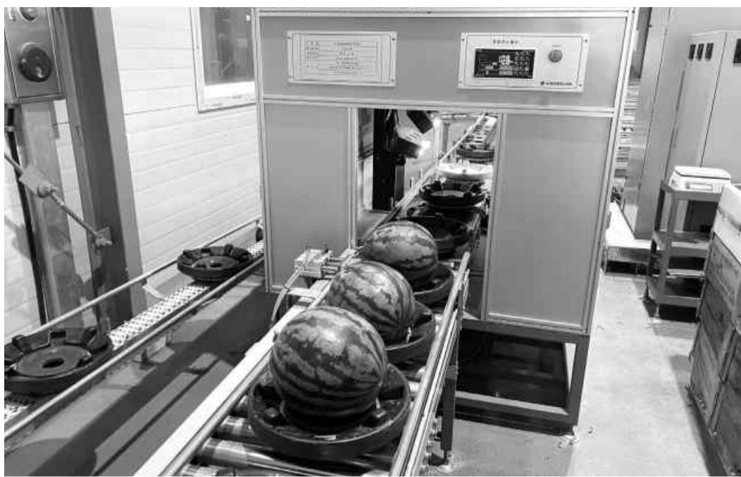
익산시가 농가소득 향상을 위한 농산물 유통체계 구축사업에 집중 투자한다. 수박 자동 선별 시스템.

48개 사업에 278억원 투입 농가 소득·안전 먹거리 역점 푸드통합지원센터 4월 착공