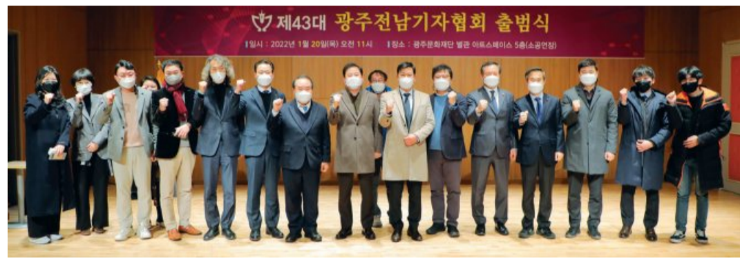
20일 광주 남구 광주문화재단 별관 아트스페이스 5층 소공연장에서 제43대 광주전남기자협회 출범식이 열린 가운데 참석자들이 기념촬영을 하고 있다.