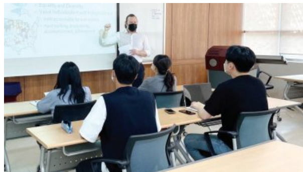
조선대 해외취업 연수과정 ‘K-Move스쿨’.

운영 결과 연수생 15명은 전원 취업에 성공했으며, 연수생들은 미국 남동부에 위치한 앨라배마주의 국내 대기업 미주지사 등 다양한 취업처에서 근무