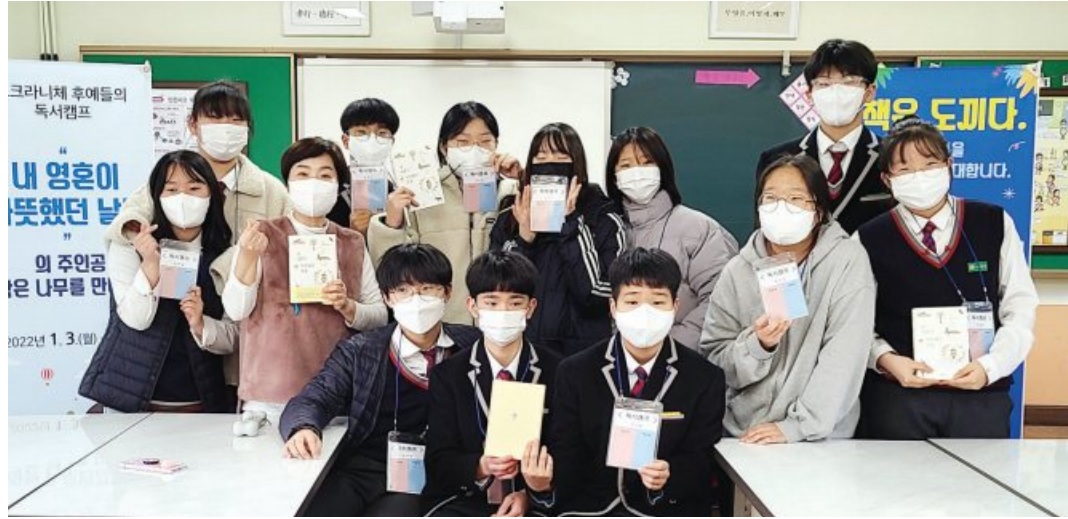
여수 여양중 인문독서동아리 소속 학생들이 ‘여양소크라니체의 후예, 참자아를 디자인하다’라는 책을 선보이고 있다.