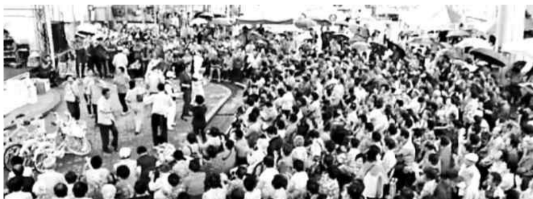
장흥 정남진토요시장 이벤트 상설공연 모습.

장흥군 관계자는 “자치단체 세출예산집행기준상 1년 단위로 상인회와 대행사간 계약을 해야 함에도 3년 계약을 맺어 인정할 수 없다”고 말했다