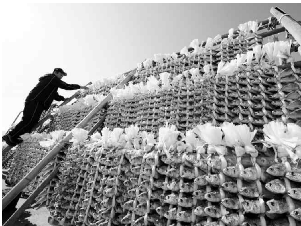
영광 한 굴비 사업장에서 작업자가 해풍에 구들구들 말린 최상품 영광굴비를 만들기 위해 덕장에 굴비 두름을 걸치고 있다.

시제까지 등록이 완료되면 영광굴비 브랜드 강화와 판매 증진에 많은 기여를 할 것으로 기대하고 있다.