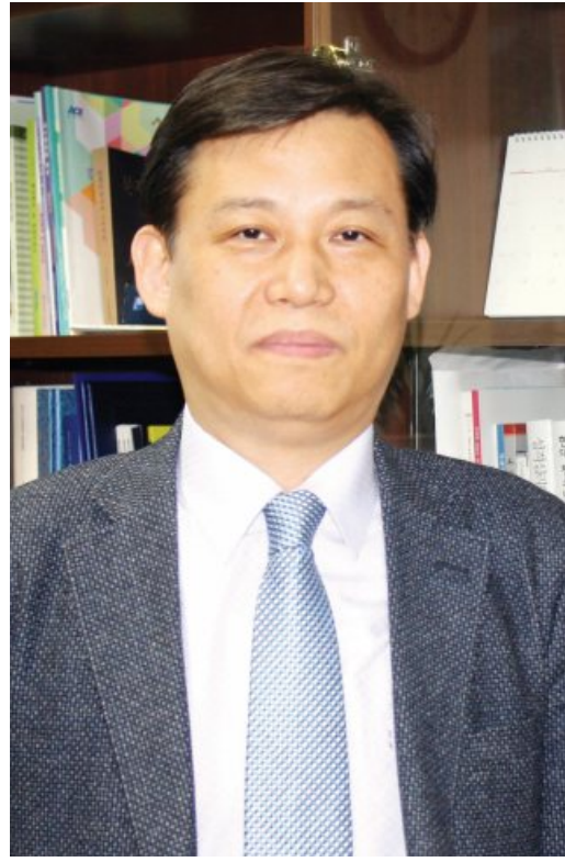
센터 호남권 유치에 힘을 쏟았다. 광주·전남 및 제주 지역 학교와 아동·청소년 시설·시민단체·사회복지기관 등 174개 기관 대표자와 상담사, 교육복지사 등도 뜻에 동참해 최근 240여명으로 구성된 위