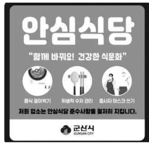
군산시안심식당 지정 스티커.

하고 소상공인의 부담을 덜어주는 한편 음식점 안에서 코로나19 전파를 최소화하기 위한 조치"라고 말했다. /군산=박금석 기자 nogusu@