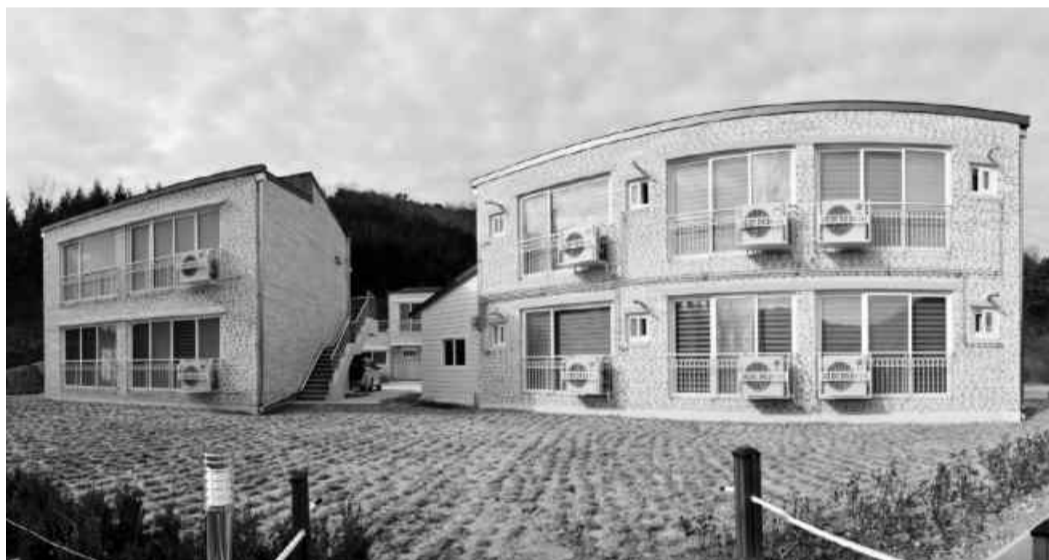
순창군이 '순창에서 한 달 살아보기' 사업 숙소로 제공하는 구립면 소재 체재형 가족 실습농장.

참가 자격은 타 지역에 주민등록을 3년 이상 둔 사람으로, 만 19세부터 54세 미만이다. 청년층 유입을 위해 39세 미만 청년에 대해서는 선정 시 우