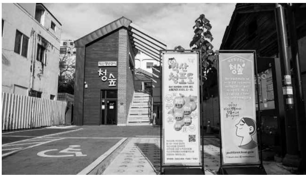
익산시 청년정책의 허브인 '청숲' 전경. 익산시는 청년들의 지역 정착과 자립을 위해 올해 14개 사업을 추진한다.

시, 14개 사업에 55억원 투입 청년 정책의 허브 '청숲' 통해 상담·정보 제공·교류 네트워크 근로청년수당·구직활동비 지원