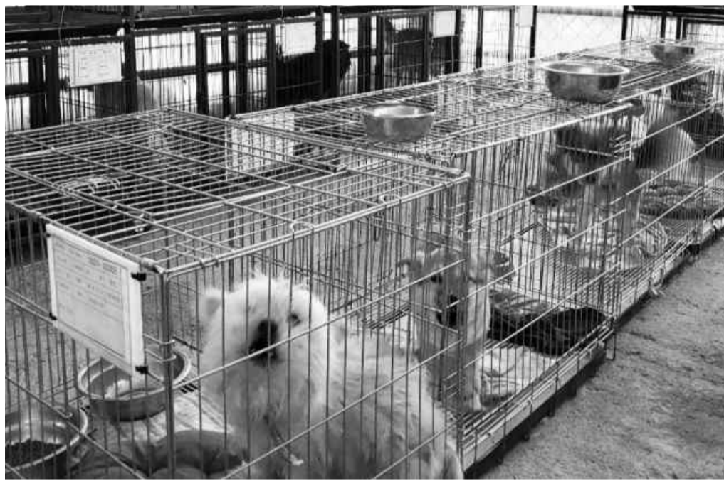
동물보호소에서 입양을 기다리고 있는 유기견들.

이와 함께 시는 유기·유실 동물이 사회적으로 문제가 되는 것을 예방하기 위해 마당 등 실외에서 키우는 개를 대상으로 중성화 수술비 지원사