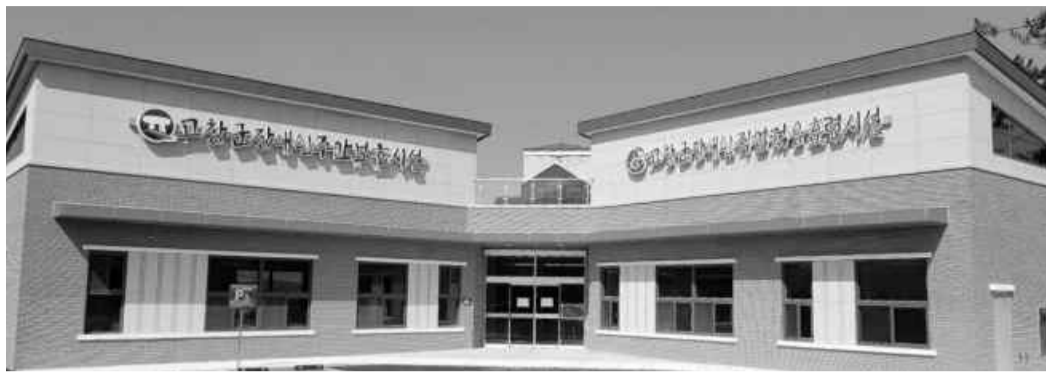
최근 완공된 고창군장애인주간보호시설과 장애인직업적응훈련시설.

장애인연금 2.5% 인상 활동지원·돌봄 서비스 확대 일자리 참여자 임금 상향