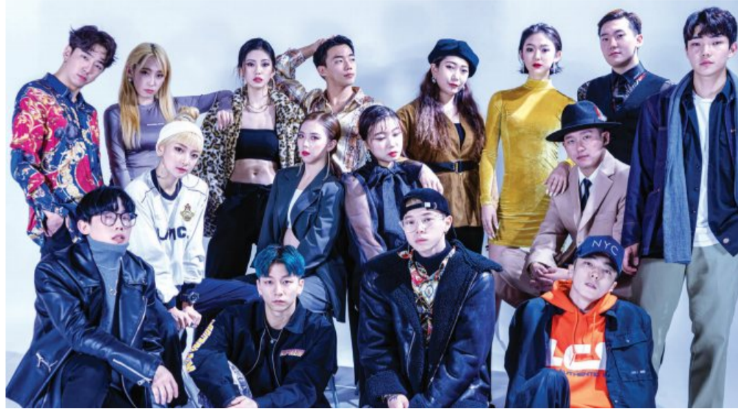
빛고를 댄서스 멤버들.

“광주 출신 댄서들이 고향에 돌아와 활동할 수 있는 자리를 만들자는 생각도 있었죠. 광주 댄서들이 예술대학 진학을 위해 타 지역으로 떠난 뒤 광주로 돌아올 이유가 없었거든요. 이곳 스튜디오에서 배운 뒤 대학 졸업 후 돌아와 스튜디오 강사를 맡고 있는 이들도 있어요.”