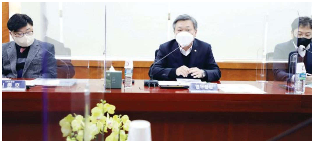
정석환(가운데) 병무청장이 최근 광주전남지방병무청을 방문해 방혁현장을 점검하고 직원들과 '미래 병무행정 업무 발전'을 위한 정책토론회를 실시했다. 정 청장은 “앞으로도 사회 환경 변화를 반영한 적극적인 행정서비스를 제공하여 국민들이 공감하고 체감할 수 있는 병무행정을 추진해 달라”고 당부했다.