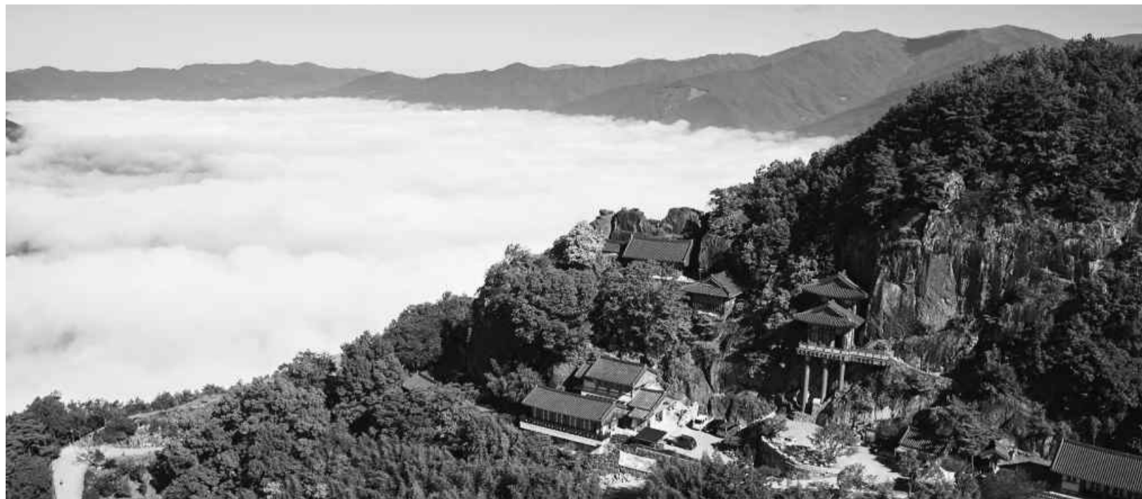
케이블카가 설치될 예정인 구례 사성암 일대.

구례읍~사성암 2.34km...1600억 경제유발·700명 고용창출 효과 기대