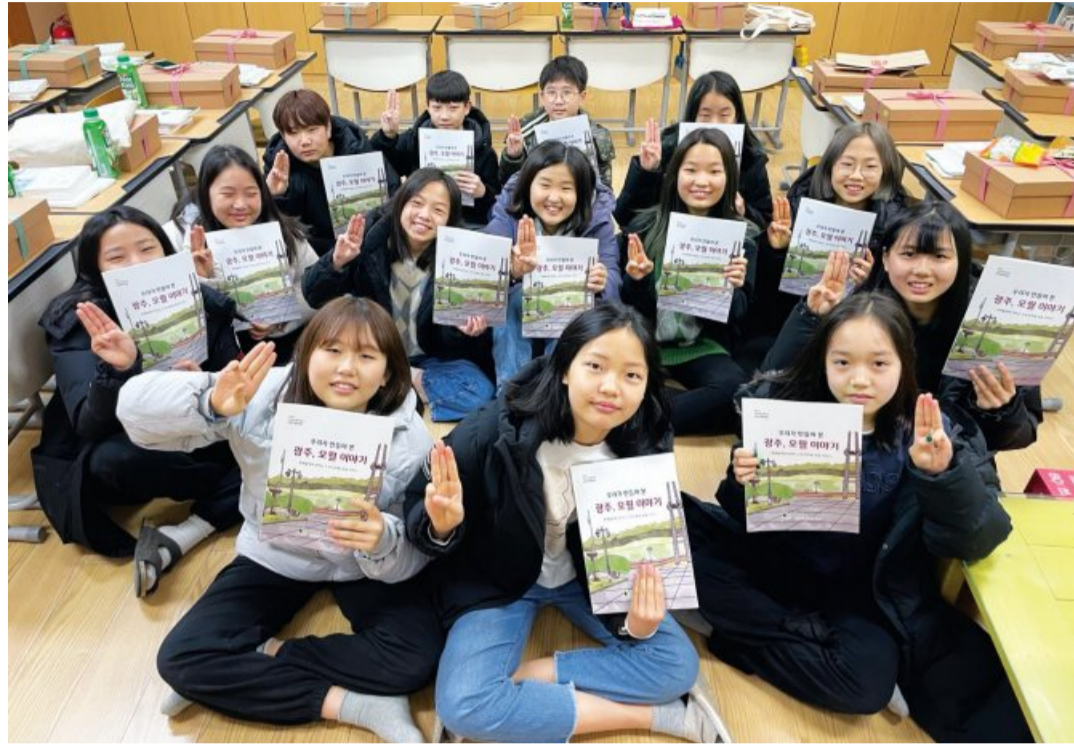
5·18 교재 ‘우리가 만들어 본 광주, 오월 이야기’를 제작한 충남 아산 거산초 6학년 학생들.

학생들과 함께 책을 만든 박진환 교사는 학년 초, 우리 역사 중 가장 큰 상처로 남았고 해결할 것 많은 5·18 광주민주화 운동과 아이들이 온전히 만나길 바랐다. 그러려면 스스로 찾아 공부하고, 그걸 나누는 게 필요하다고 생각해 좀 더 쉬운 언어로 교재를 만들어 후배들에게 전해주면 어떨까 제안했다. 박 교사는 “아이들이 정말 고맙고 자랑스럽다”며