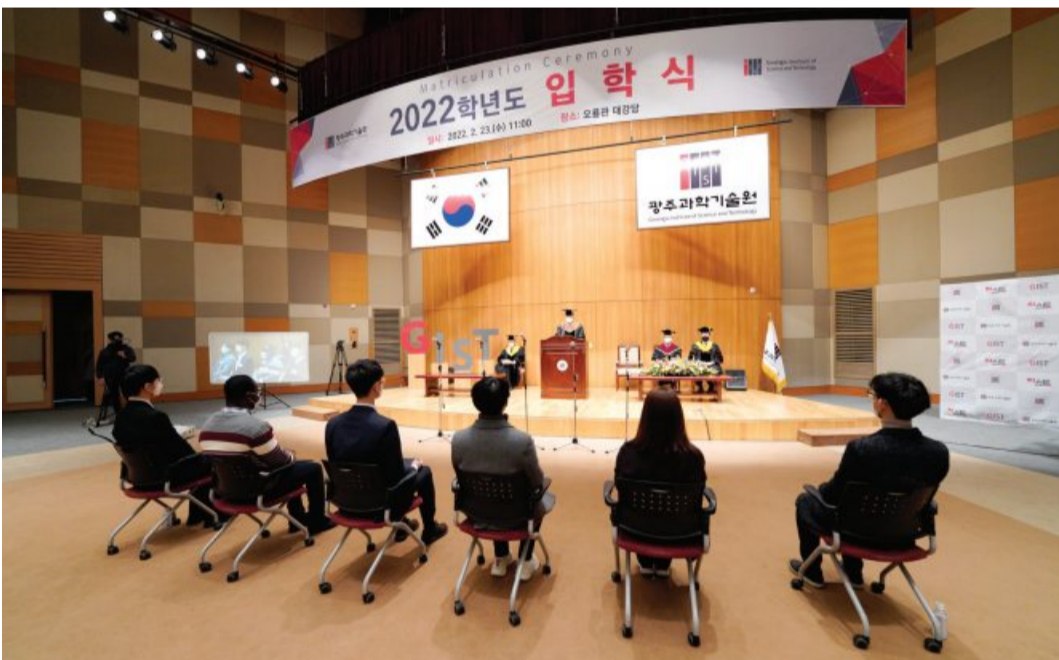
지스트(광주과학기술원, 총장 김기선)가 23일 지스트 오희관 대강당에서 입학생 대표와 총장장학생 대표, 주요 보직자 등 20여명이 참석한 가운데 2022학년도 입학식을 개최했다. 올해 상반기 입학생은 학사과정 219명, 석사과정 121명, 석박통합과정 52명, 박사과정 46명 등 총 438명이다.