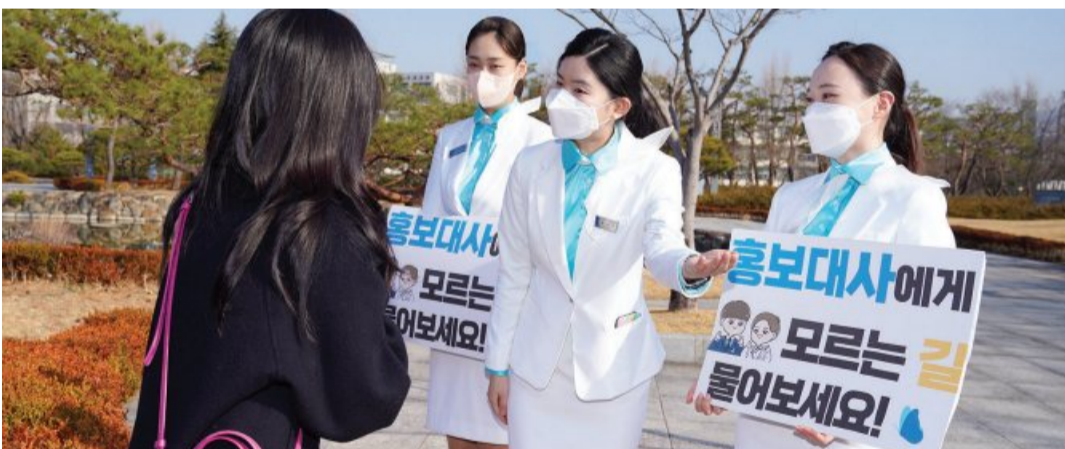
조선대학교가 학교 일상 회복을 위해 대면수업을 재개한 가운데 홍보대사를 학교 곳곳에 배치해 눈길을 끌고 있다. 최근 조선대학교는 홍보대사인 '푸른라래' 5명을 교내 곳곳에 배치하고 길에서 서운 신입생을 대상으로 강의실과 편의시설 등 캠퍼스 곳곳을 안내했다.