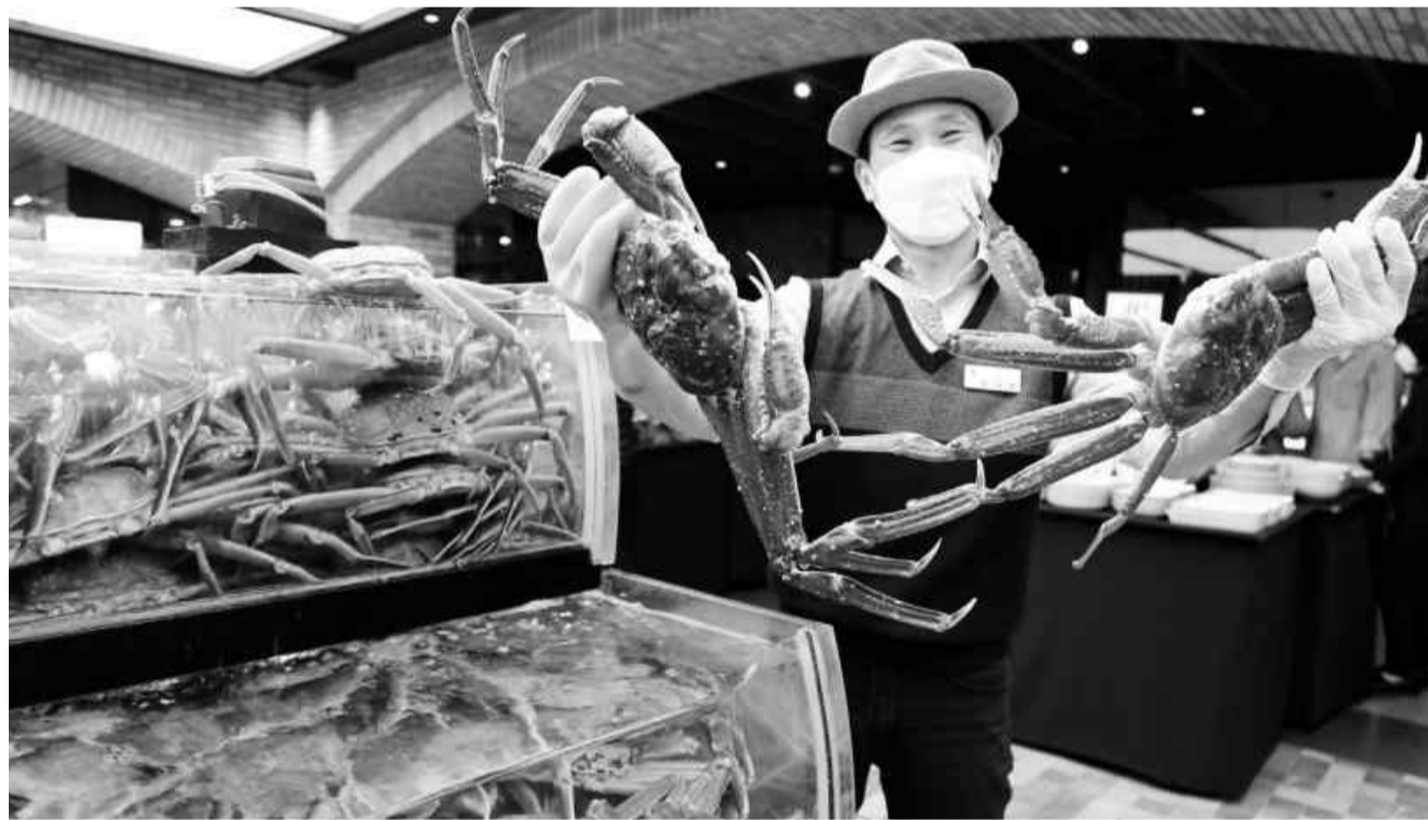
"제철 맞은 울진대게 맛보세요"

무상태가 건전한 베트남 현지 수입기업을 발굴한다. 베트남 시장 진출을 바라는 기업은 오는 25일까지 전남도 수출정보망 홈페이지(www.jexport.or.kr)에서 온라인 신청을 하고, 증명서류는 전남도 중소기업진흥원에 전자우편(kimsh_1224@jepa.kr)으로 별도 제출하면 된다. 확정된 참가기업은 오는 5월 8일부터 12일까지 베트남 하노이와 호치민을 직접 방문해 현지 기업과 수출상담을 하게 된다. 전남도는 러시아의 우크라이나 침공으로 힘든 도내 수출 중소기업을 위해 '전남도 수출정보망(www.jexport.or.kr)'에 수출피해 신고센터를 운영하고 있다. /윤현석 기자 chadol@kwangju.co.kr