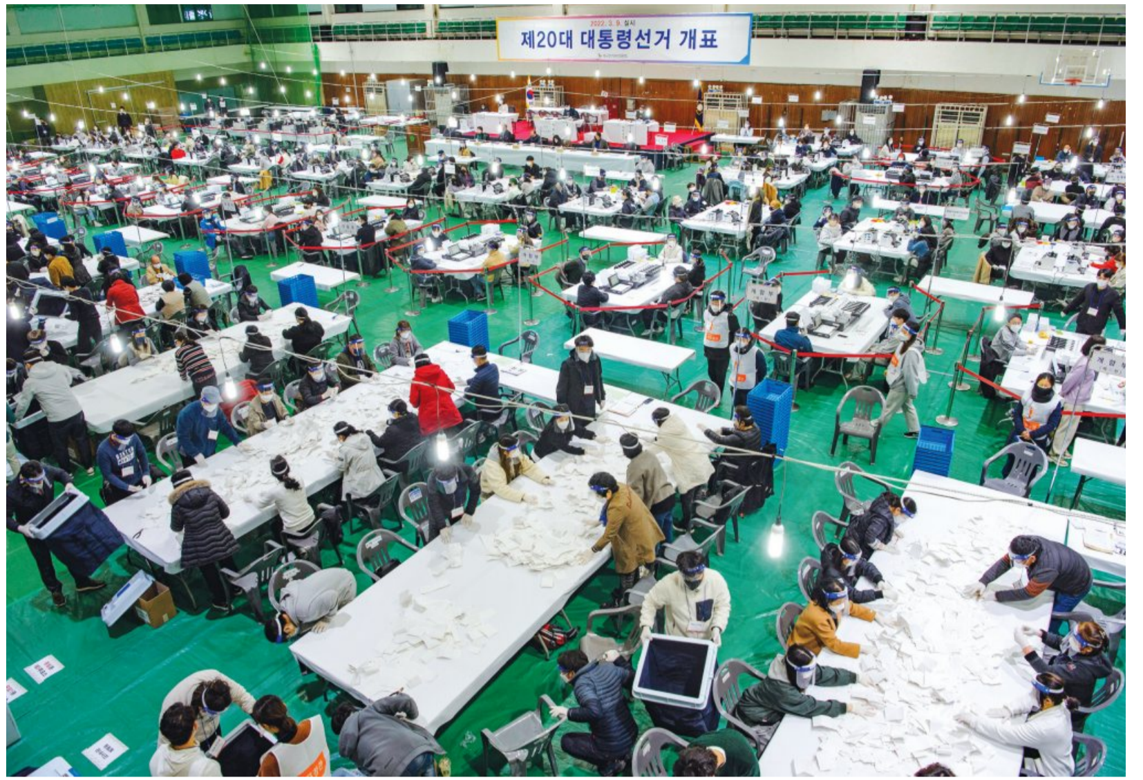
제20대 대통령 선거일인 9일 오후 광주 북구 용봉동 전남대체육관에 마련된 개표소에서 종사원들이 개표작업을 하고 있다.

반면 18~29세 여성은 이 후보 60.2%, 윤 후보 31.5%로 이 후보에게 압도적인 지지를 보였다.