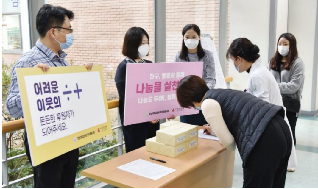
학마을봉사회가 회원 모집에 나선 가운데, 두 명의 직원이 가입 서명을 하고 있다.

환자들을 도왔다. 병원 내 환자들만 지원하는데 그치지 않았다. 의료 취약계층을 발굴하기 위해 광주시 5개 구청은 물론 화순군청과 의료서비스 협약을 맺어 소외된 이웃을 찾아가고 있다. 또 회원들이 모은 기금은 인건비나 기타 부대 비용으로 전혀 사용하지 않고 100% 환자를 위해 사용하고 있다. 의료지원뿐 아니라 사회복지시설 성금, 위문품 전달, 소외 지역 의료봉사 등 다양한 봉사과 기부 활동을 병행해 왔다. 류현호(응급의학과 교수) 학마을봉사회 부회장은 “전공의 시절 학마을봉사회 때문에 취약계층 환자가 치료 받는 것을 보고 감동받아서 70~80여명의 전공의들과 함께 한거리에 가입했다”며 “이젠 병원 안에서 의료사각지대 환자를 발견하면 의료진들이 나서서 학마을봉사회로 연결해주겠다는 말이 먼저 나올 정도로 왕성하게 활동 중”이라고 말했다. 학마을봉사회에서는 현재 회원 2000여명이 활동하고 있으며, 지금까지 1807명의 환자에게 21억원