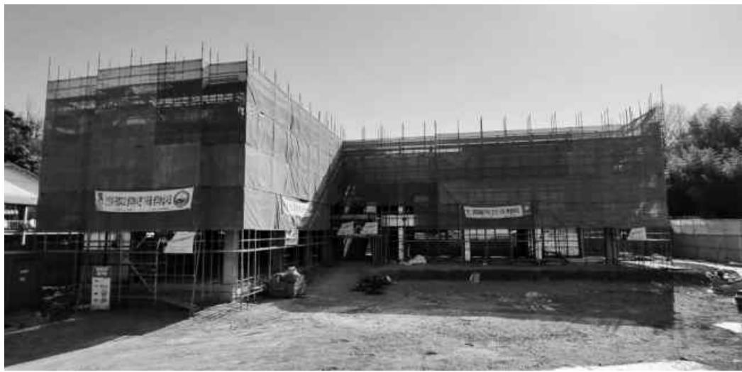
장성군이 중장기 프로젝트와 주요 현안사업에 속도를 내고 있다. 5월 완공을 앞두고 공사가 한창인 노인회관 건립 현장.

노인회관·로컬푸드 직매장 등 4건 상반기 내에 완료 26건 올해 안에 마무리