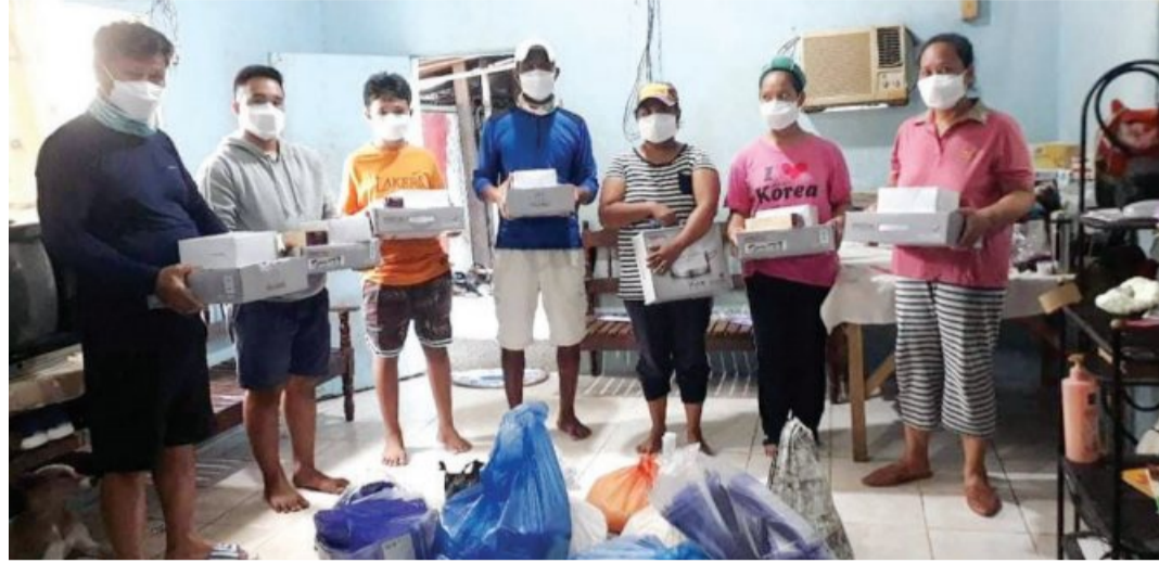
곡성 필리핀 결혼이민자가족들이 곡성군가족센터가 지원한 구호물품을 들고 감사를 표하고 있다.

안타까운 소식을 전해 들은 곡성군 가족센터. 다문화가족, 곡성 주민들은 십시일반으로 성금 70만 원을 모았다. 쌀, 의류, 학용품, 냄비, 차약, 마스크 등 생활용품 등을 무려 1t가량 모았다. 가족센터는 모금과 구호 물품 확보 활동의 구심점 역할을 했다. 물품을 수집하고 포장할 적절한 장소를 마련해 제공했으며, 마스크와 생활용품을 후원했다. 구호 물품을 필리핀까지 보내는 데 필요한 비용 130만원을 지원하기도 했다. 필리핀 결혼이민자 A씨는 “주민들과 센터가 함께 마련해준 후원금과 구호 물품이 1월 말에 필리핀