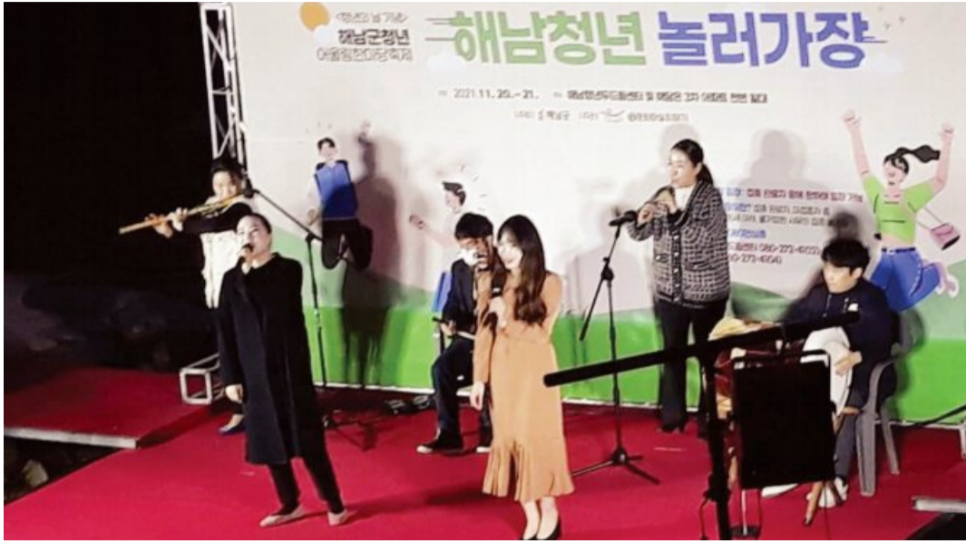
해남군이 청년 공감도시 조성을 위해 속도를 내고 있다. 지난해 열린 청년한마당 축제 공연.

해남군은 매년 월 10만원 주거비를 지원하는 해남청년 주거비 지원사업, 청년들의 모인 활동비를 지원하는 청년 커뮤니티 활성화 지원사업 등 새로운 사업을 선보여 호응을 얻어왔다.