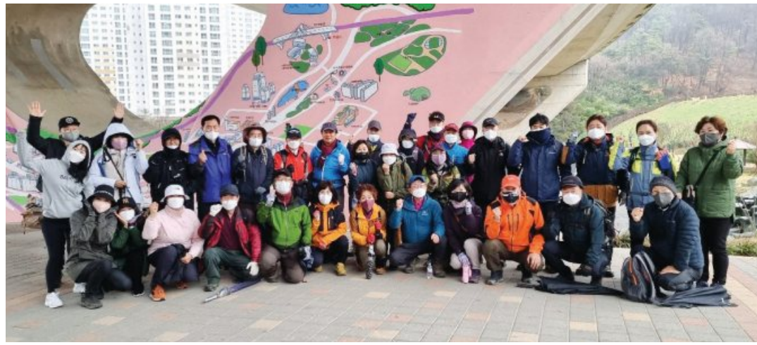
빛고을산들길사랑모임 회원들이 빛고을 산들길을 걷은 뒤 기념촬영하고 있다.

빛길모는 매월 셋째 주 토요일 오전 9시부터 12시까지 정기 걷기 모임을 하고 있다. 지난 19일에도