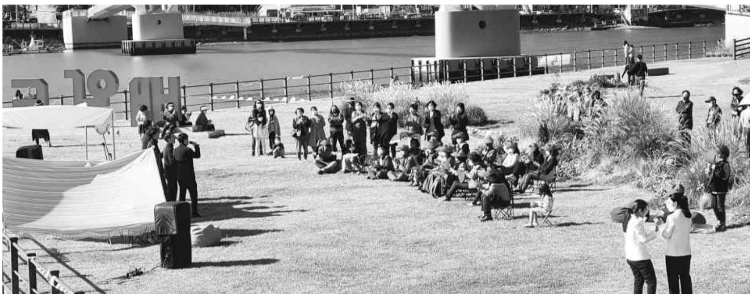
지난해 10월 배알도 버스킹 공연 장면.