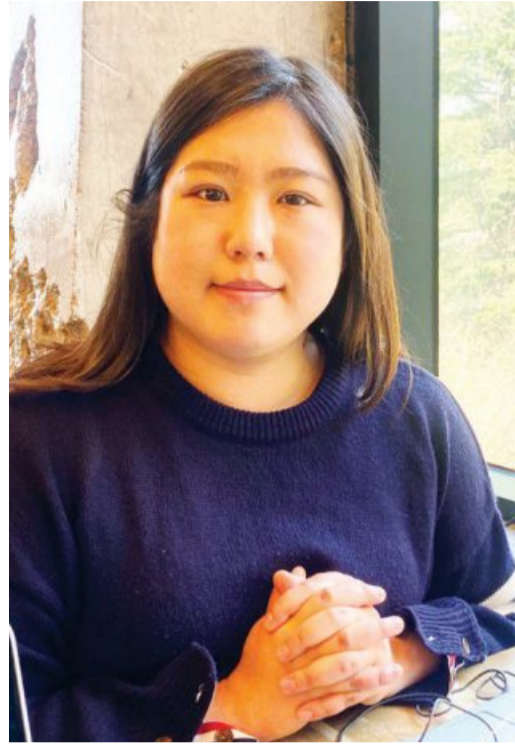
고용 형태가 불안정한 것은 물론 4대보험 등 기본 혜택도 받지 못하고 있고. 예컨대 디지털 플랫폼을

그는 “광주는 비교적 청년 경제활동 인구가 많지 않은 편인데도, 많은 노동 문제에 노출돼 있다”고 설명했다. 산재 사고부터 직장 내 집단 괴롭힘, 초단시간 노동, 비전형 노동, 취업난으로 인한 청년 고립 등이 그 예다. 이들이 청년 주거, 부채 등 현실과 얽혀 복합적인 어려움을 겪고 있다는 설명이다. 김 위원장은 특히 비전형 근로자들의 현실에 주목했다. 비전형 근로자는 비정규직 근로자 중에서도 파견, 용역, 가정 내(재택, 가내) 근로자, 일일(단기) 근로자, 플랫폼 근로자, 1인 독립계약자(프리랜서) 등으로 일하는 특수 형태 근로자를 뜻한다. “비전형 근로자는 노동법의 사각지대에 있어요.