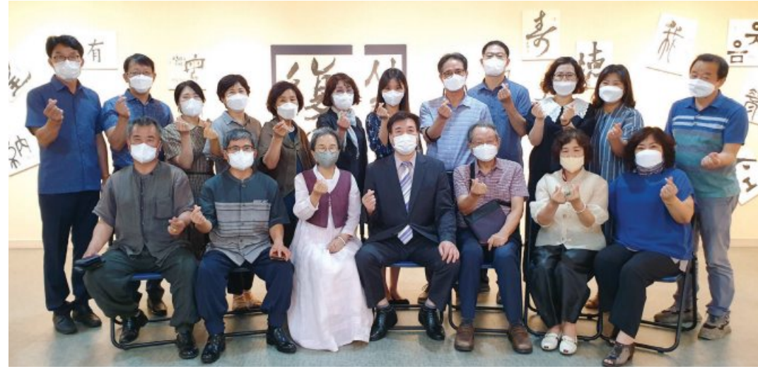
순천교육지원청에서 여순사건을 주제로 서예 특별전을 연 청필락 회원들.