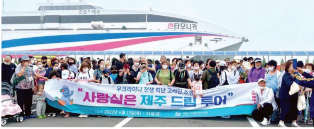
고려인마을 150명이 최근 씨월드고속훼리 지원으로 제주드림투어를 다녀왔다.

고향인 우크라이나 미콜라이우를 떠나 물도바와 루마니아를 거쳐 고려인마을이 제공한 항공편을 받아 한국에 왔다는 박스베틀라나(45)씨는 “낮선 조