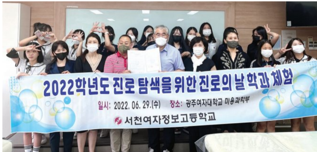
광주여자대학교(총장 이선재) 미용과학부는 지난 29일 서천여자정보고등학교 재학생 20명을 대상으로 학과 체험 행사를 진행했다.