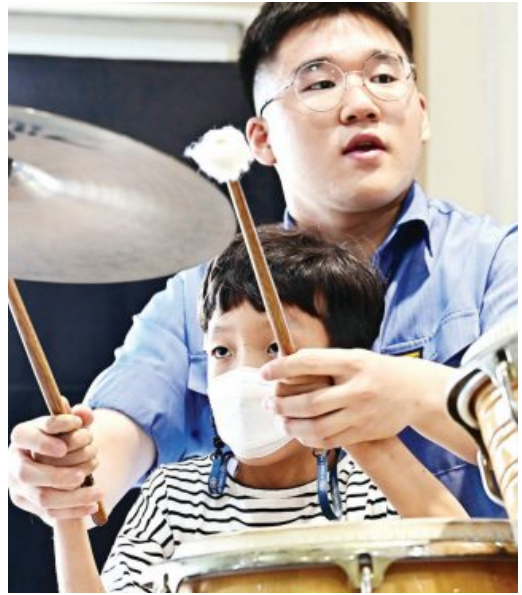
3함대 군악대원이 은광학교 학생에게 악기를 지도하고 있는 모습.

우리 바다를 지키는 군인들과 시각장애인 학생들의 20년째 이어진 특별한 인연이 눈길을 끈다. 해군 제3함대사령부(이하 3함대) 군악대는 영양군 삼호읍 시각장애인 특수학교 ‘은광학교’ 학생들에게 드럼, 트럼펫, 플룻 등 다양한 악기 수업을 진행하고 있다. 매주 한 차례, 두 시간씩 은광학교 관악부 학생들은 3함대 군악대를 찾아 악기 수업을