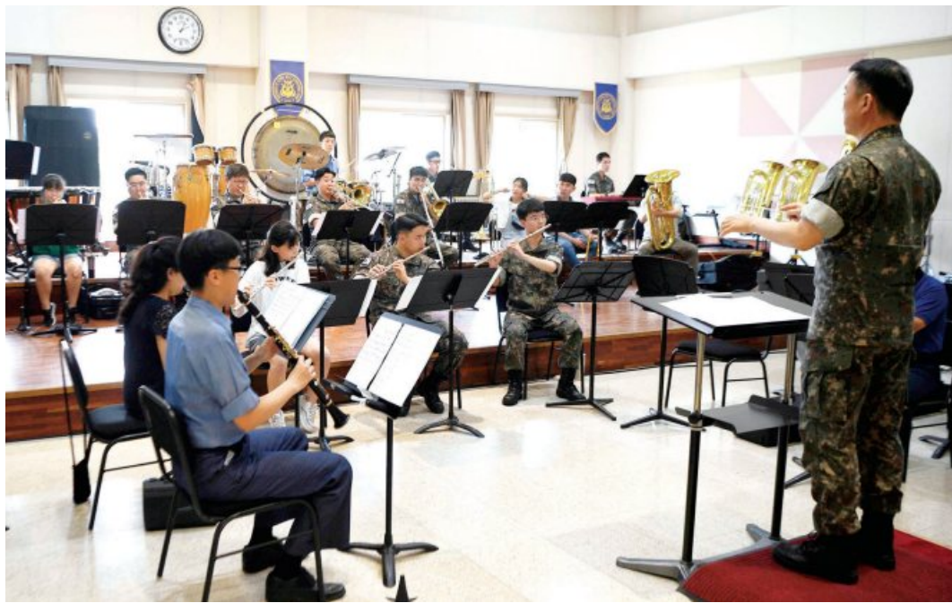
3함대 군악대원들과 은광학교 학생들이 함께 악기를 연주하고 있다.

(17)양은 “악보를 볼 수 없으니 당연히 내가 스스로 악기를 연주한다는 것은 상상도 못했다”면서 “그러나 지금 악기를 연주하는 제 모습을 볼 때면 무엇이든 해낼 것 같은 자신감이 든다”고 말했다.