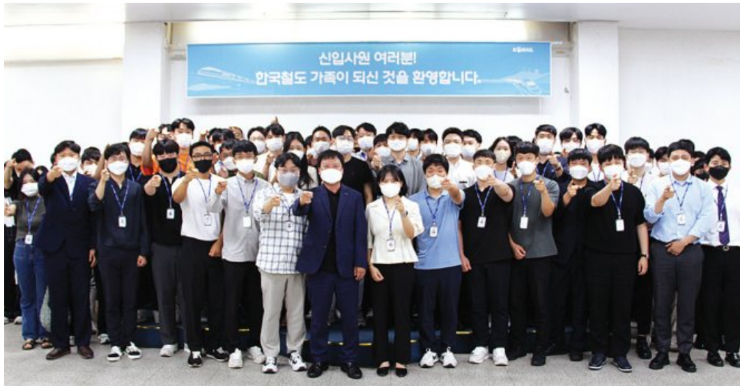
한국철도(코레일) 광주전남본부는 최근 올 상반기 신입사원 환영행사 및 오리엔테이션을 개최했다. 호남권 신입사원 71명은 한국철도 광주전남본부 관내 영업·기술 분야에 배치돼 근무를 시작한다.