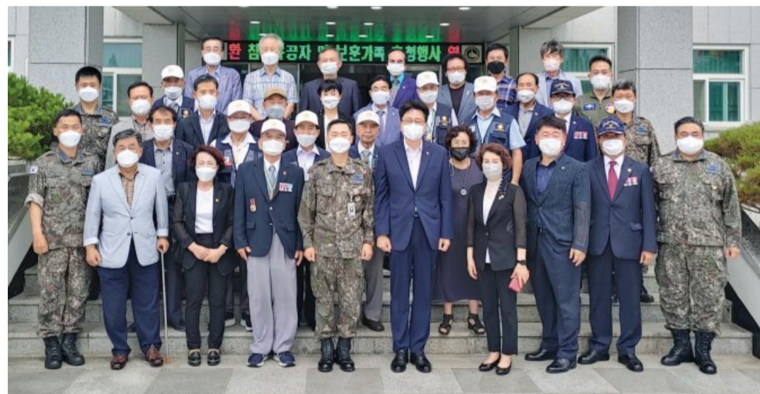
광주지방보훈청(청장 임종배)은 최근 공군 제1전투비행단에서 개최하는 보훈가족 초청행사에 참석했다. 류진산 제1전투비행단장은 참전유공자 및 보훈가족 30명을 초청해 부대체험 등 다양한 행사를 열었고 임종배 보훈청장은 국군장병들에게 위문금을 전달했다.