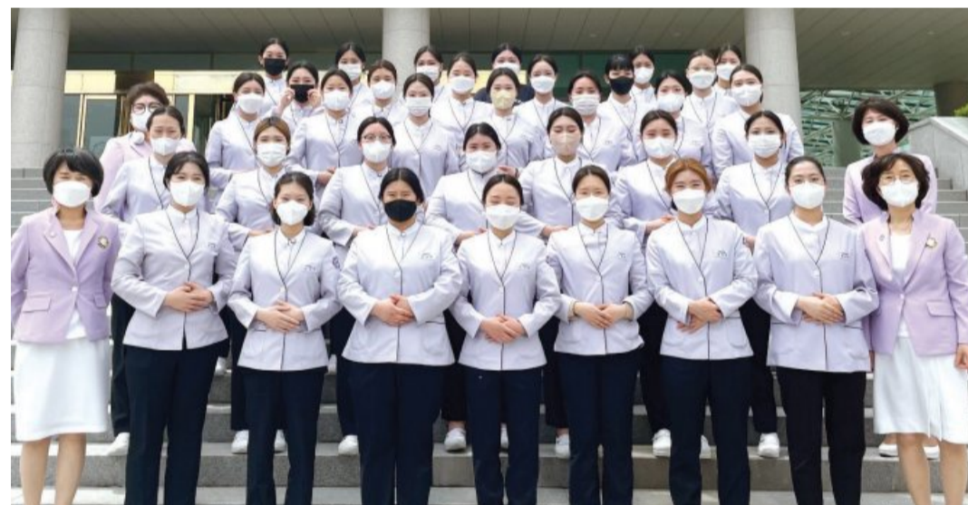
광주여자대학교(총장 이선재) 치위생학과는 최근 학생, 대학원생, 졸업생 등이 참여해 ‘제 11회 예비치과위생사 선서식 및 학술제’를 온라인으로 개최했다.