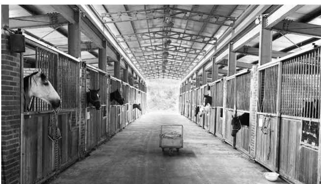
장흥승마체육공원에 전기공급이 중단되면서 사육장 물 공급이 끊겨 교육원에서 사육하고 있는 말들이 어려움에 처했다. 장흥승마체육공원 말 사육장 내부.