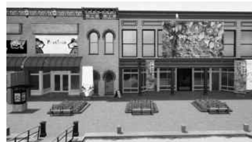
강진 한국민화뮤지엄이 ㈜스마트큐브와 함께 메타버스 전시장을 구축했다.