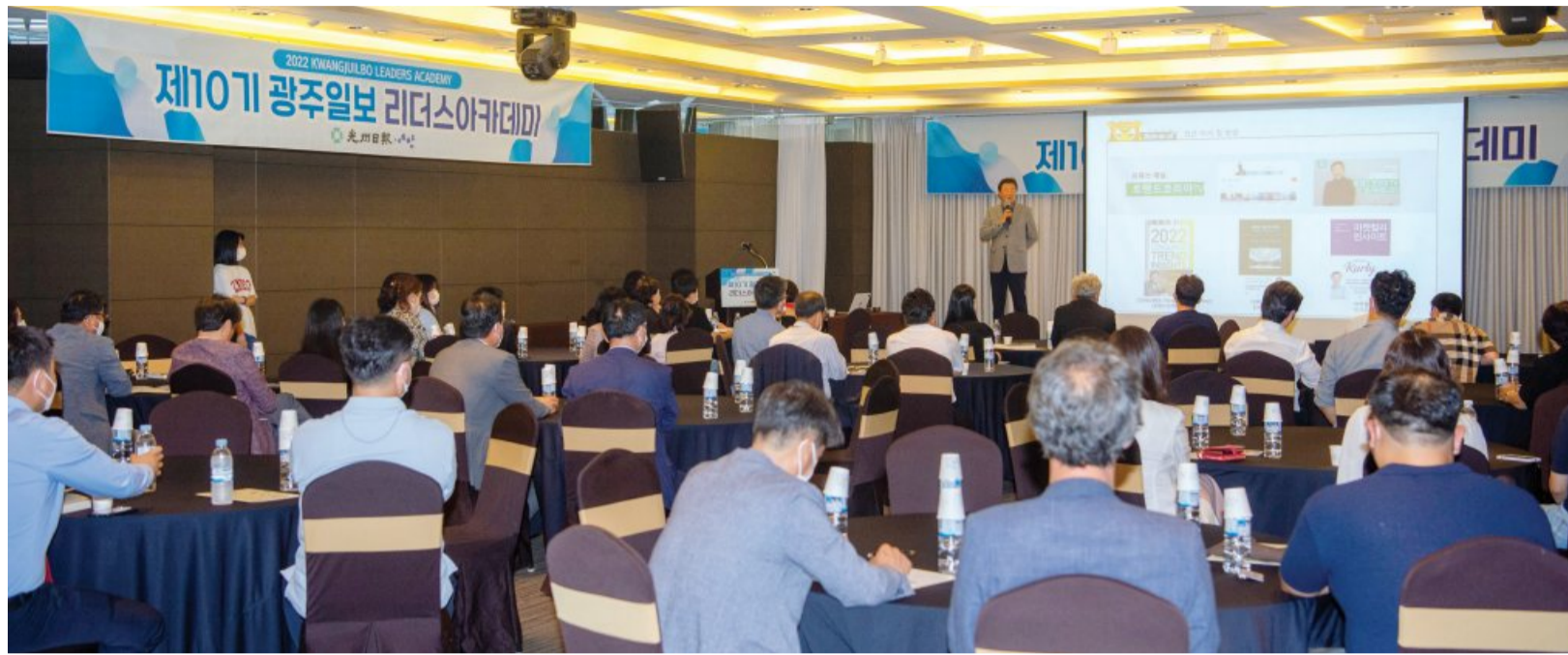
김난도 서울대 소비자학과 교수가 지난 5일 라마다플라자 광주호텔에서 열린 제10기 리더스아카데미에서 ‘TIGER OR CAT’을 주제로 강연하고 있다.

그는 첫 번째로 ‘나노사회’에 대해 설명하면서 “나노사회란 단일사회가 아니라 구성원이 나노단위로 잘게 나뉘어진 사회를 말한다”며 “스마트폰, 알