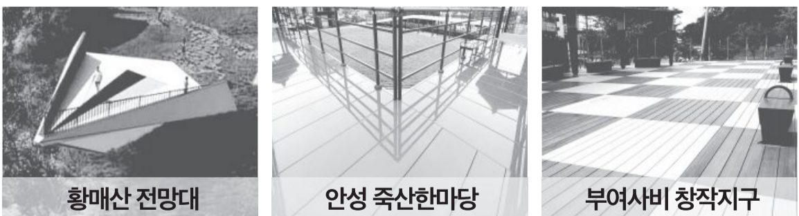
항매산 전망대, 안성 죽산한미당, 부여사비 창작지구