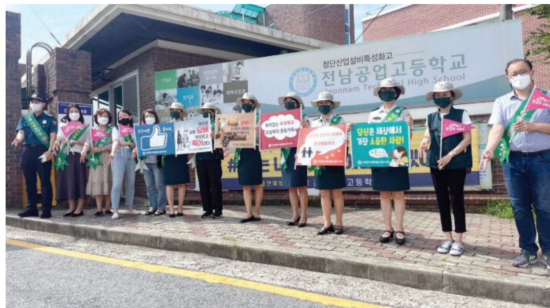
광주서부교육지원청이 최근 광주광산경찰서 학교전담경찰관, 파트너맘 광주지부, 전남공고 교직원 및 학생회와 함께 학교폭력 및 교외흡연을 예방하기 위해 전남공고 주변을 중심으로 캠페인 활동을 실시했다.