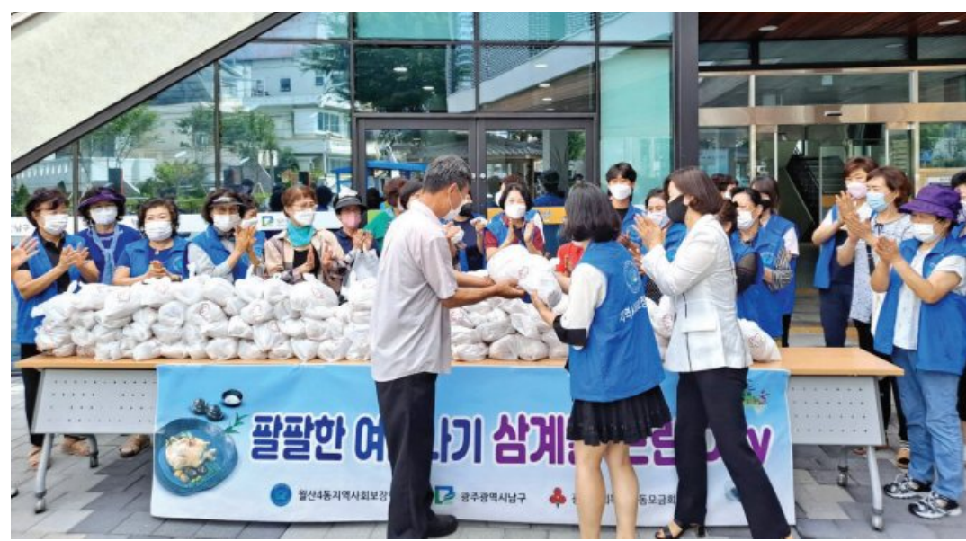
광주시 남구는 최근 월산4동 행정복지센터에서 무더위 극복을 위한 삼계닭 나눔 전달식을 열고 최근 익명의 독자가 기부한 200만원 상당 삼계닭 300마리를 경로당, 지역아동센터 5곳, 저소득 가정 등에 전달했다.