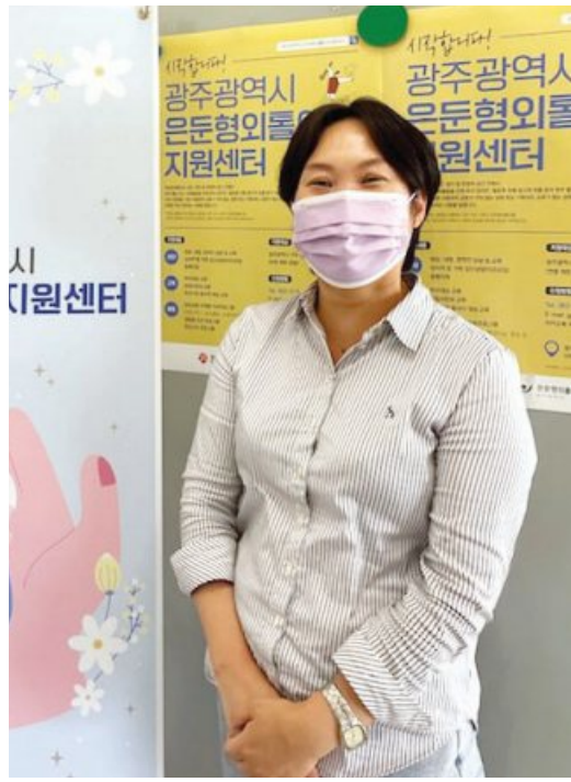
행한 조사 결과, 은둔형 외톨이는 349명에 이르는 것으로 집계됐다. 그러나 센터는 광주시민 중 최소 5000명 이상의 은둔형외톨이가 있을 것으로 보고

었다. 현재 실태조사를 통해 드러난 은둔형외톨이 15사례(당사자 5명·가족 10명)를 토대로 이들을 관리 중이다.