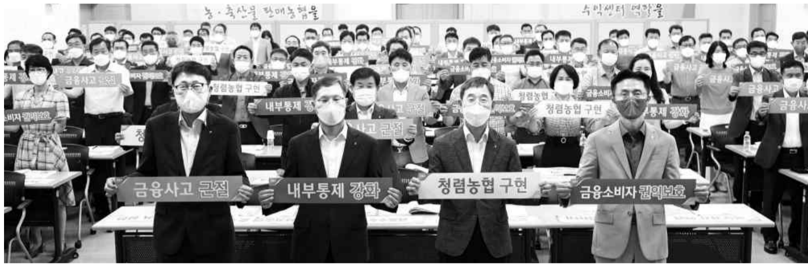
농협 전남지역본부와 지역 농·축협 상임이사 전무 150여 명이 최근 열린 '자정 결의대회'에서 임직원의 윤리의식 제고를 다짐하고 있다.

3775t으로, 40.5%(1089t) 증가했다. 김류는 지난해 상반기 32만4156t에서 올해 35만3787t으로, 9.1%(2만9631t) 증가했다. 굴류 1.9%(2만7350t→2만7880t)와 참조기 1.2%(1177t→1191t) 등도 생산량이 늘었다. 반면 올해 상반기 전년보다 생산량이 줄어든 품종은 보니 해조류에서 생산 감소가 두드러졌다. 올 들어 전남 다시마류 생산량은 39만834t으로, 전년(49만6169t)보다 21.2%(-10만5335t) 감소했다. 같은 기간 돛 생산량도 24.9%(1만5649t→1만1759t) 줄었다. 바지락(-40.2%)과 새조개(-80.2%), 꼬막(-74.5%), 오징어(-70.4%), 조피볼락(-34.5%) 등도 '두 자릿수' 감소율을 나타냈다. 고등어 생산량은 8.5%(1151t→1053t) 줄고, 참돔 15.0%(1484t→1261t), 삼치류 11.8%(3040t→2681t), 아귀류 11.6%(2180t→1928t) 등도 생산량이 감소했다. /백희준 기자 bhj@kwangju.co.kr