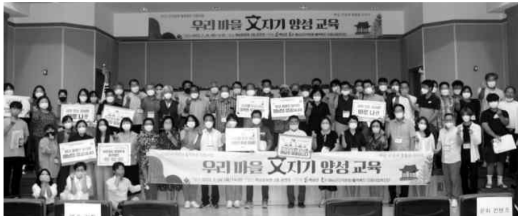
‘우리마을 지키기 양성교육’ 참가자들이 기념촬영을 하고 있다.

마을별로는 문화 콘텐츠 19개 마을을 비롯해 공간 활용 13개 마을, 예술 기획 17개 마을이 선