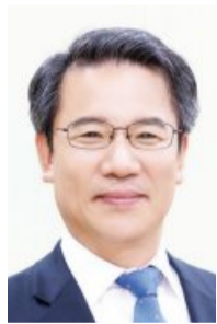
/백희준 기자 bhj@

이들은 축제 참가자들은 고향 지자체에 기부하고 특산물을 답례품으로 받는 ‘고향사랑기부제’에 많이 참여해 달라고 당부했다.