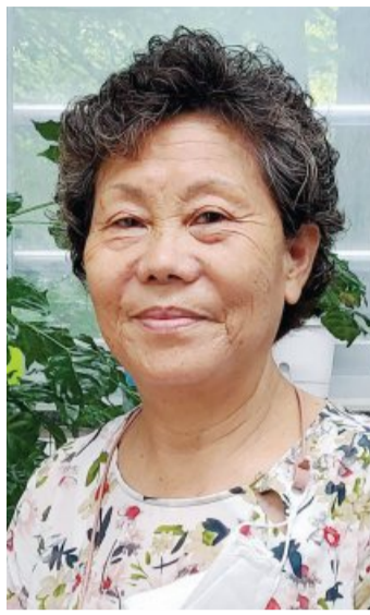
시달렸던 이 할머니에게 송정도서관 성인문해교실은 한 줄기 빛과 같았다.

강진 시골마을에서 8남매 중 넷째로 태어난 이 할머니는 네 명의 동생 뒷바라지에 학교 문턱을 넘어 본 적이 없다. 15살 무렵 동네 야학에 잠깐 나간