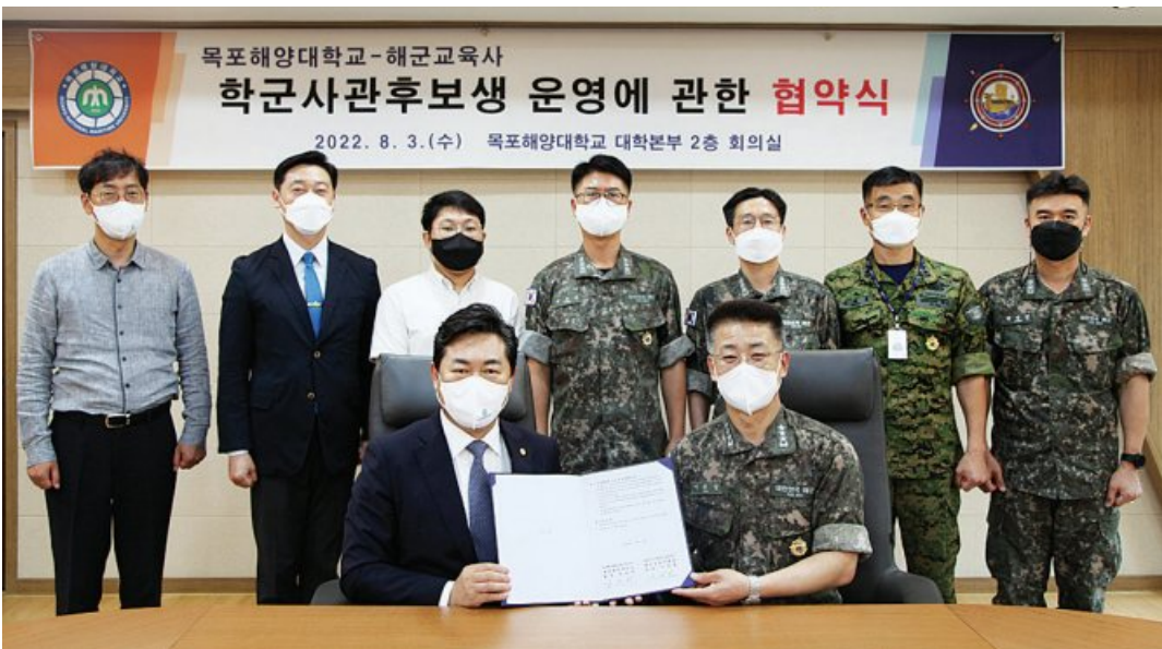
목포해양대학교(총장 한원희)와 해군교육사령부(사령관 이동길 중장)가 3일 목포해양대학교에서 학·군교류 활성화를 위한 협약을 체결했다. 이번 협약은 양 기관의 군사학 발전 및 해군 장교 육성을 위한 상호 협력을 위해 추진됐다.