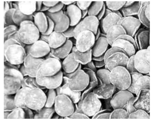
쓰레기 소각장에서 주운 66만2000원 상당 손상주화