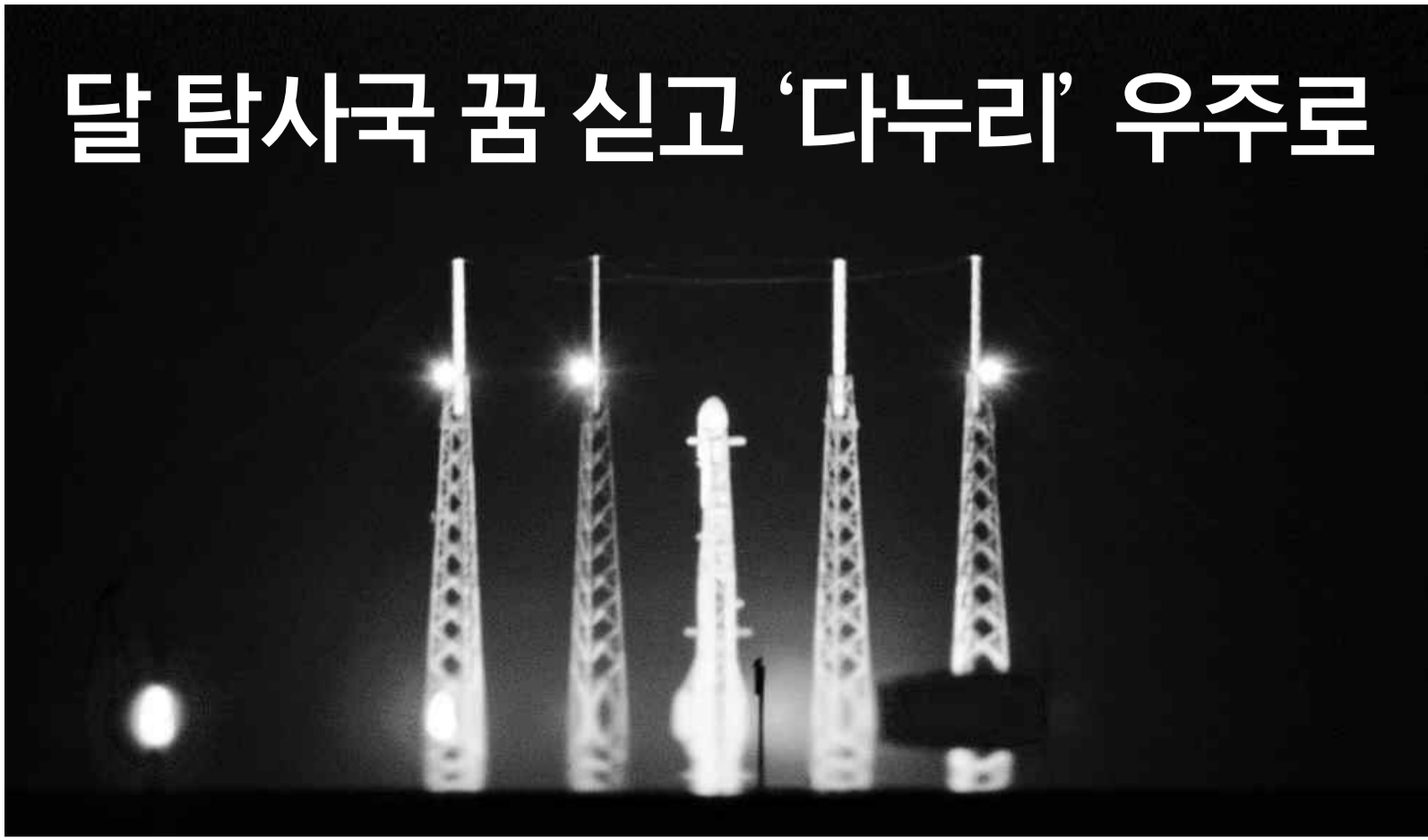
다누리를 탑재한 미국 스페이스X의 '팰컨9'이 3일 오후(현지시간) 미국 플로리다 케이프커내버럴 미우주군기지에서 기립해 있다.