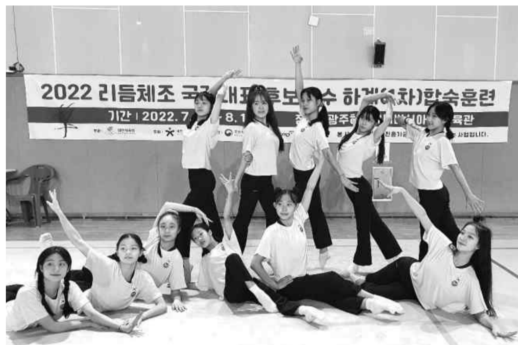
광주여대시립유니버시아드 체육관에서 하계 전지훈련 중인 리듬체조 국가대표 후보 선수들이 훈련을 마친 후 기념 촬영을 하고 있다.