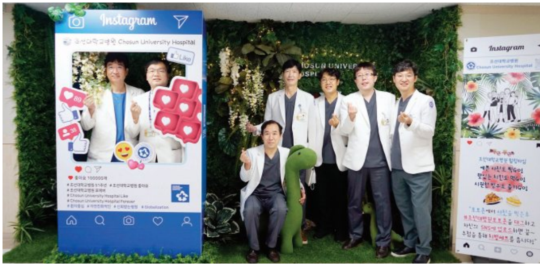
조선대병원(병원장 김경중)은 최근 병원 3관 1층 여류 공간에 ‘리틀 포-레스트(Little For-rest) 포토존’을 조성해 병원을 찾은 환자와 보호자에게 큰 호응을 얻고 있다. ‘리틀 포-레스트 포토존’은 힐링의 공간으로 작은 숲이라는 의미와 휴식을 취하다는 for Rest의 두가지 의미가 담겨있다.