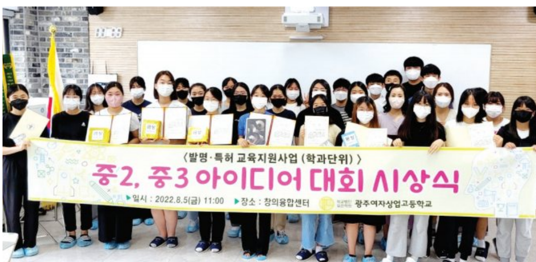
광주여자상업고등학교가 최근 학교내 창의융합센터에서 ‘중·중3 아이디어 대회 시상식’을 개최했다. 이번 아이디어 대회는 4차 산업혁명 시대에 맞는 창의융합인재를 양성하기 위해 광주여성 학생 뿐 아니라 지역 중학생들의 꿈을 응원하는 행사다.