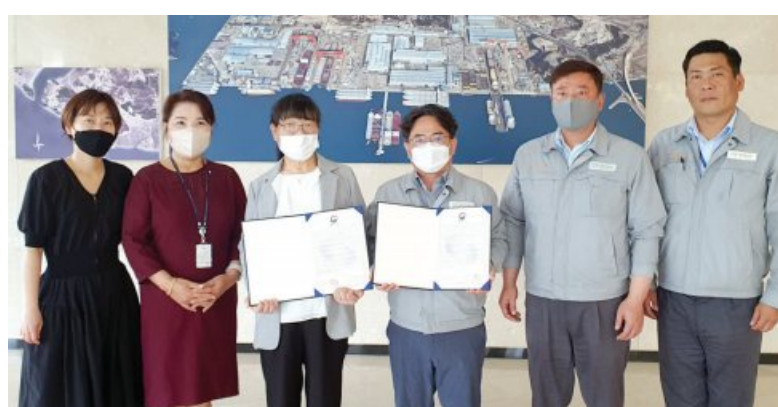
사하고 헌신한 제대군인에 대한 따뜻한 관심은 국가의 책무다”라며 “(유)다문과 긴밀한 협력체계를 구축해 제대군인에 대해 실질적인 일자리가 창출될 수 있도록 노력하겠다”고 말했다.