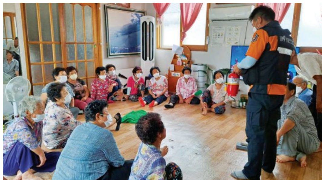
보성소방서 119생활안전순찰대는 최근 폭염 장기화로 인해 보성군 조성면 일대 자연마을 경로당과 무더위 쉼터에서 ‘찾아가는 무더위쉼터 소방안전교육’을 운영했다.