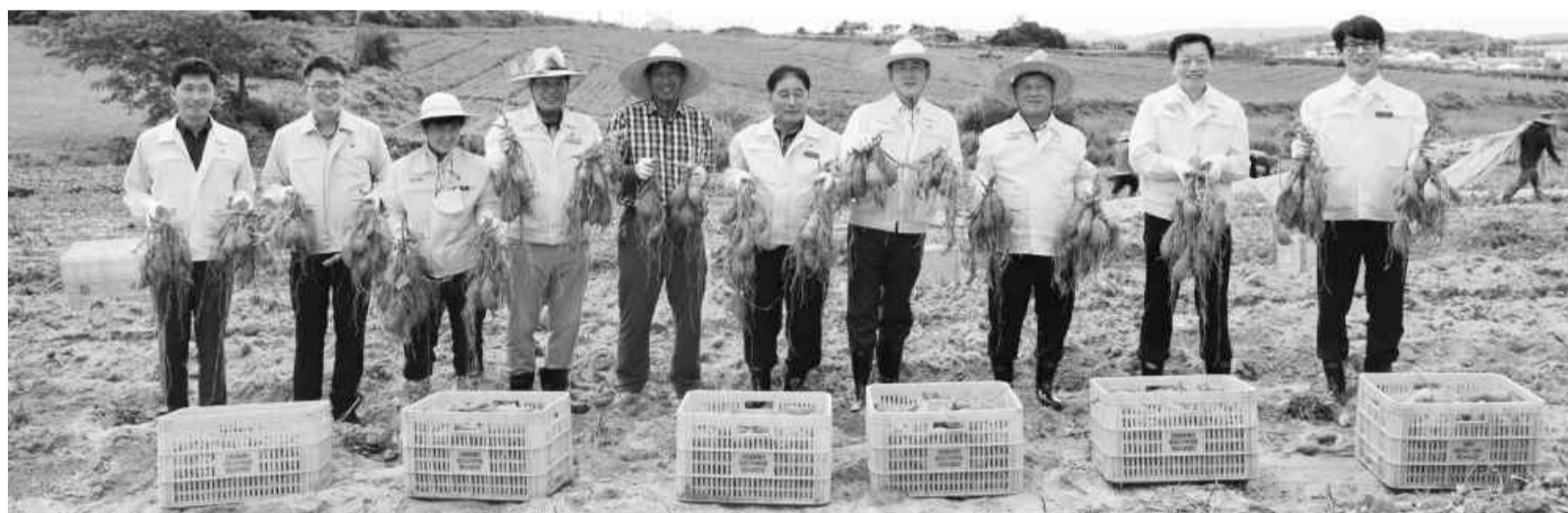
"고창 황토 고구마 맛 보세요"

고창 황토에서 자란 달콤한 고구마 수확이 본격화됐다. 게르마늄과 미네랄 등 영양이 풍부한 황토지대에서 자란 고창 고구마는 당도가 높고 맛이 달아 소비자들의 주목을 받고 있다. 고창군은 고구마 주산단지 1200여 농가에서 1250ha를 재배하고 있다.