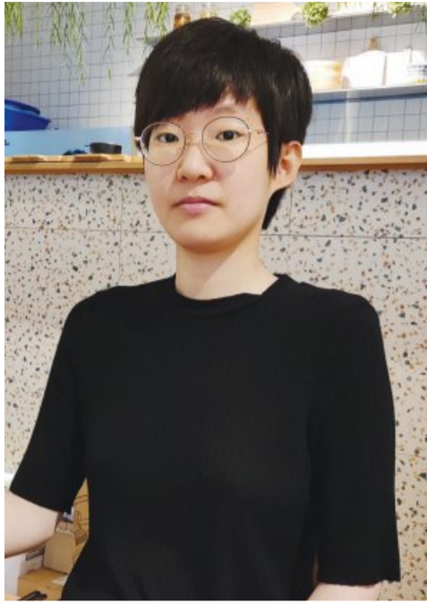
사기록물 자료를 발굴하고 정리하는 역할을 맡아 전남지역 근대사 연구에 대한 방향을 정하고 경향