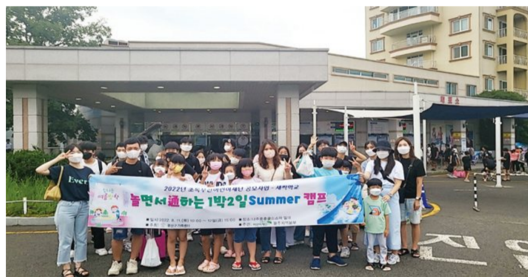
광산구 가족센터(센터장 장은미)는 어린이재단 광주지역본부(본부장 김현민)와 송정2동 기관단체협의회(회장 김중선) 후원으로 최근 다문화가족 중도입국 자녀와 북한이탈가족 제3군 출생 청소년 등 30명이 참여한 가운데 나주 중흥리조트워터파크에서 여름 힐링캠프를 가졌다.