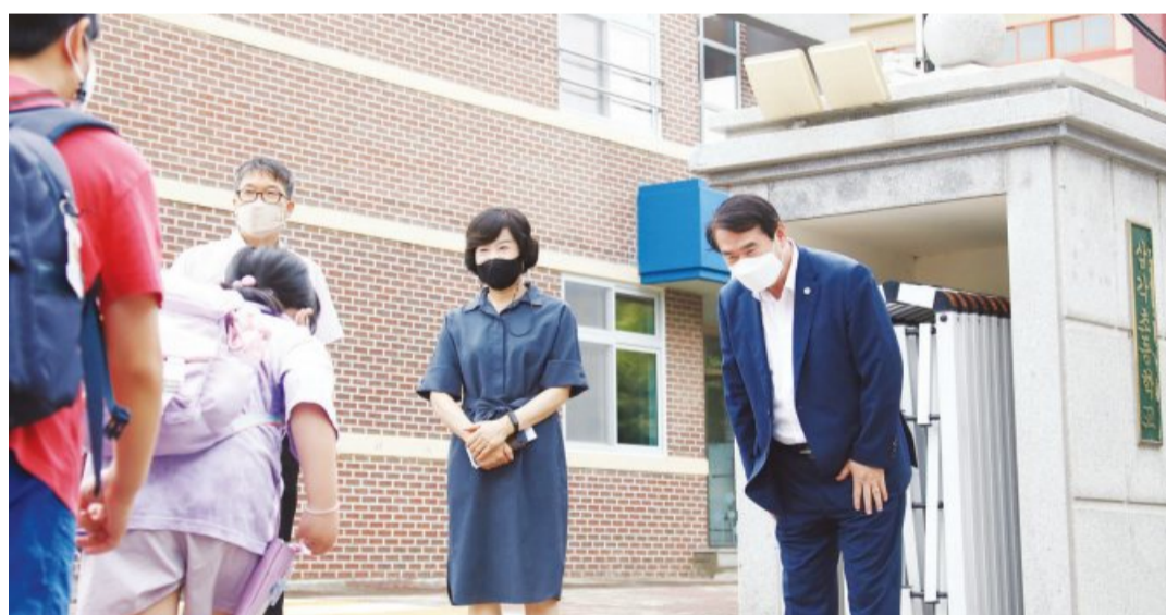
이정선 광주시교육감이 17일 삼각초등학교를 방문했다. 이날 삼각초등학교는 광주 초등학교 중 처음으로 개학해 2학기를 맞이했다. 이 교육감은 등굣길과 교문 앞에서 학생들을 반갑게 맞으며 소통했다.