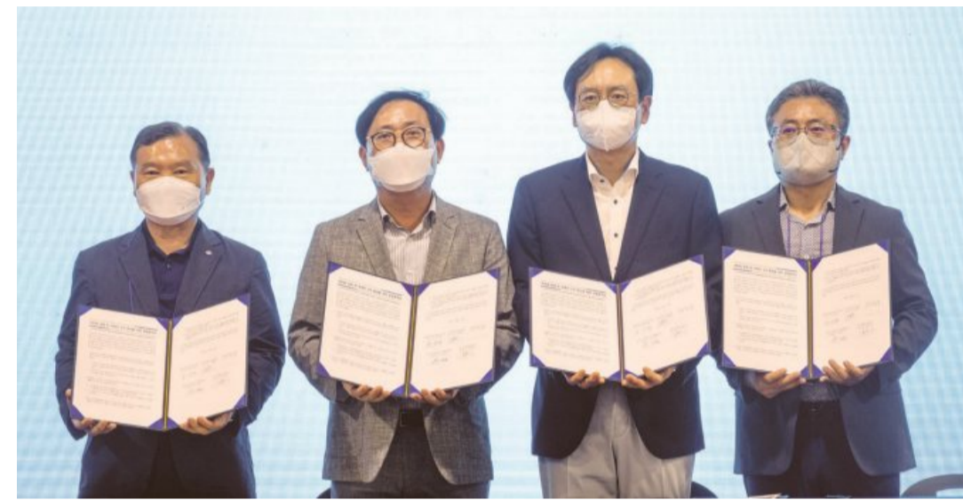
원하겠다”고 말했다. ‘바이씨’는 전남도와 전남어촌특화지원센터가 소포장이 가능하거나 직거래를 바라는 전남 우수어