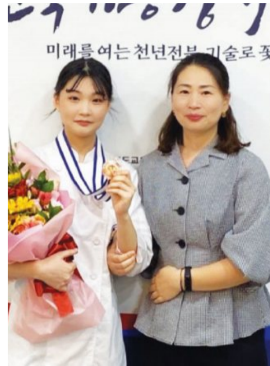
때부터 요리대회에 나가기 시작했고요. 각종 행사에 나가 봉사하면서 요양원 식사도우미, 무료급식

“고등학교에 입학하면서부터 요리학원에 등록하고 본격적으로 요리를 배웠습니다. 고등학교 1학년