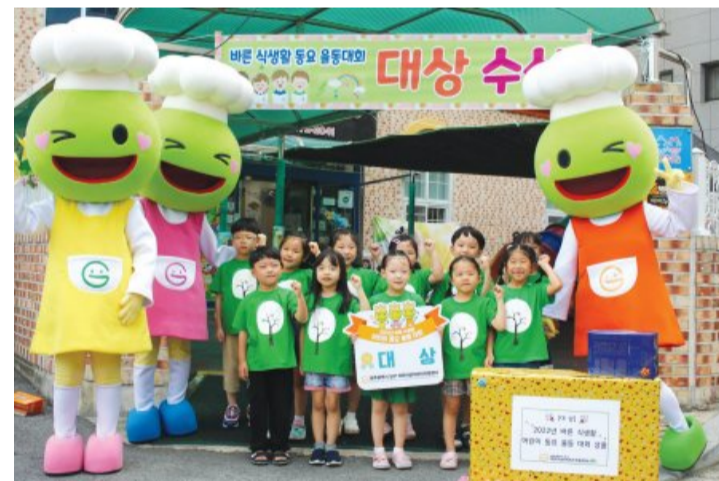
포마덴서상(실로암어린이집·서현어린이집·예쁜어린이집), 참가상(푸른숲어린이집) 등이 수상했다. 광주대 어린이급식관리지원센터는 대상 수상기관 참여 어린이와 원장, 교사의 인터뷰를 진행해 특별영상을 제작할 예정이다.