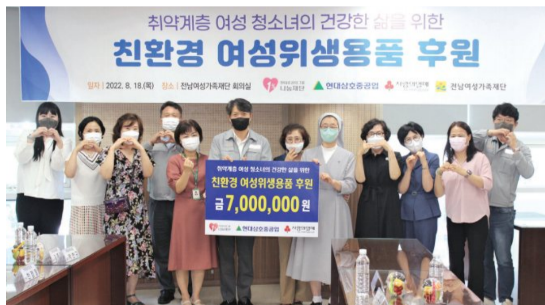
현대중공업그룹 1% 나눔재단(이사장 권오갑)은 최근 목포·무안지역 여성보호시설 7개소에 700만 원 상당의 여성위생용품을 지원했다.