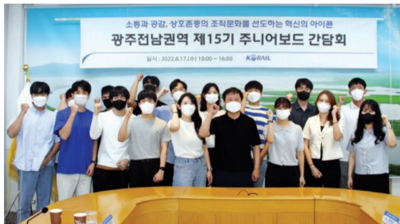
이날 회의의 화두는 ‘안전’으로 철도 현장에서의 산업재해와 시민재해 근절을 위한 방안을 중점 논의했으며 철도 이용객 불편 해소를 위한 설비 개선 및 홍보마케팅, 서류 간소화를 통한 업무효율화 및

한국철도(코레일) 광주전남본부는 최근 철도혁신과 소통의 아이콘으로 맹활약중인 주니어보드(청년이사회)와 대화가 나눴다고 밝혔다. <사진> 주니어보드는 세대 간, 직렬 간 보이지 않는 벽을 허물며 코레일의 변화와 혁신의 조직문화를 만드는 데 기여하고 있는 MZ세대로 구성됐다.