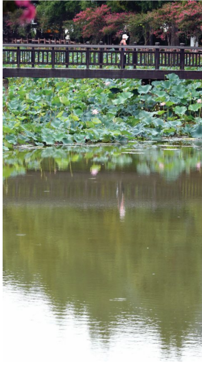
지난 6월 발생한 광주 서구 풍암호수공원(왼쪽) 녹조가 여전히 짙은 초록색을 띠고 있다. 이에 비해 인근 매월동 전평호수공원은 녹조 없이 비교적 깨끗한 수질을 유지해 대비를 이루고 있다.