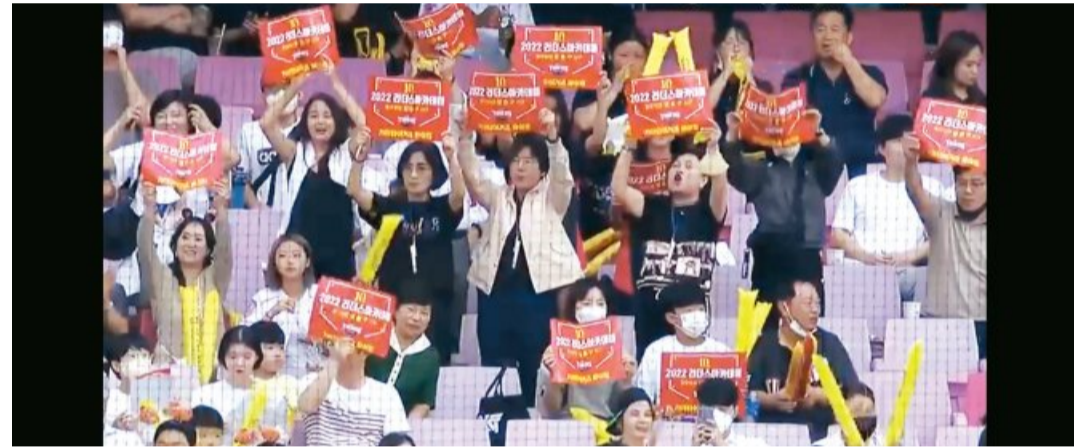
지난 2일 챔피언스필드를 찾아 경기를 관람 중인 광주일보 리더스 아카데미 10기 원우들. <TV중계화면 캡처>