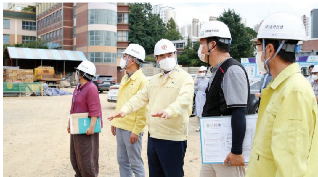
이정선(왼쪽에서 세번째) 광주시교육감이 4일 제11호 태풍 힌남노 복상에 따라 동구 계림초등학교 공사현장을 방문해 태풍 대비 상황을 점검하고 있다.