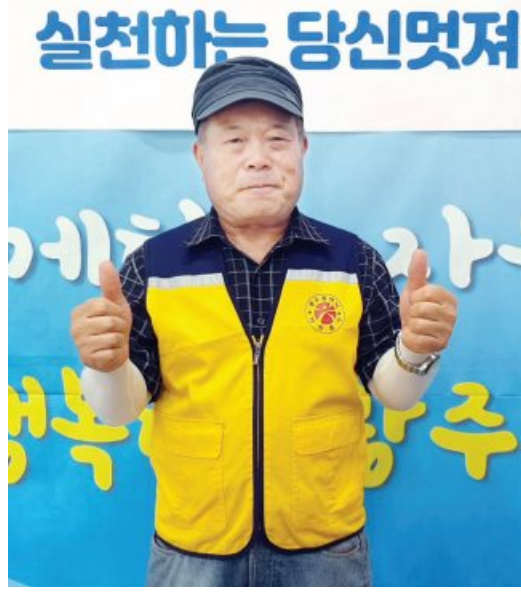
환경을 생각하는 의미있는 일이지만 폐 팔레트를 수거하고 분해해 화분으로 만드는 과정 모두 서씨 몫이다. 변변한 일당도 없는 탓에 작업을 도와주는 이가 없다. 서씨가 누가 시키지 않아도 재능기부에 나선 이유

그의 화분은 기후위기 대응에 함께 참여하고자 하는 아파트에 전달된다. 인기가 좋아 주문량을 따라가지 못하는 실정이다.