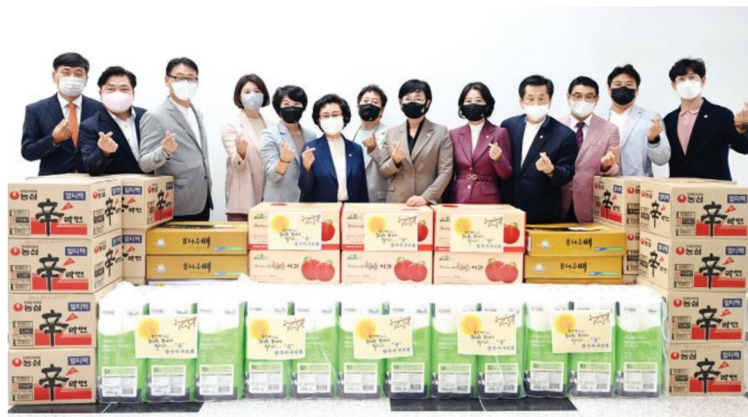
광주 서구의회(의장 고경애)는 6일 민족고유 명절인 추석을 앞두고 어려운 이웃과 함께하는 따뜻한 사회 공동체 확산을 위해 관내 사회복지시설에 위문품을 전달했다.