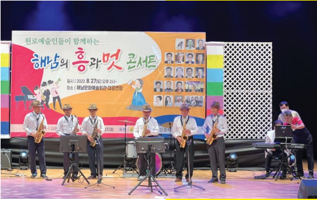
▲전남문화재단이 예술인 지원사업에서 소외되고 있는 만 70세 이상의 원로 예술인을 위한 지원 방침에 따라 마련한 '남도 원로예술인 스페셜' 무대.