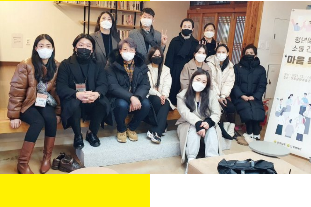
▶전남문화재단은 청년 예술가를 지원하기 위한 다양한 사업을 추진하고 있다. 문화재단이 지난해 개최한 청년예술가들의 소통간담회.

문화예술진흥기금 200억 조성 창작활동 지원 등 다양한 문화 사업 5개 지자체와 '문화재단협의회' 출범 전남만의 문화 거버넌스 구축 공공예술사업·실버마이크 등 공모사업 8건 유치 국비 13억원 확보