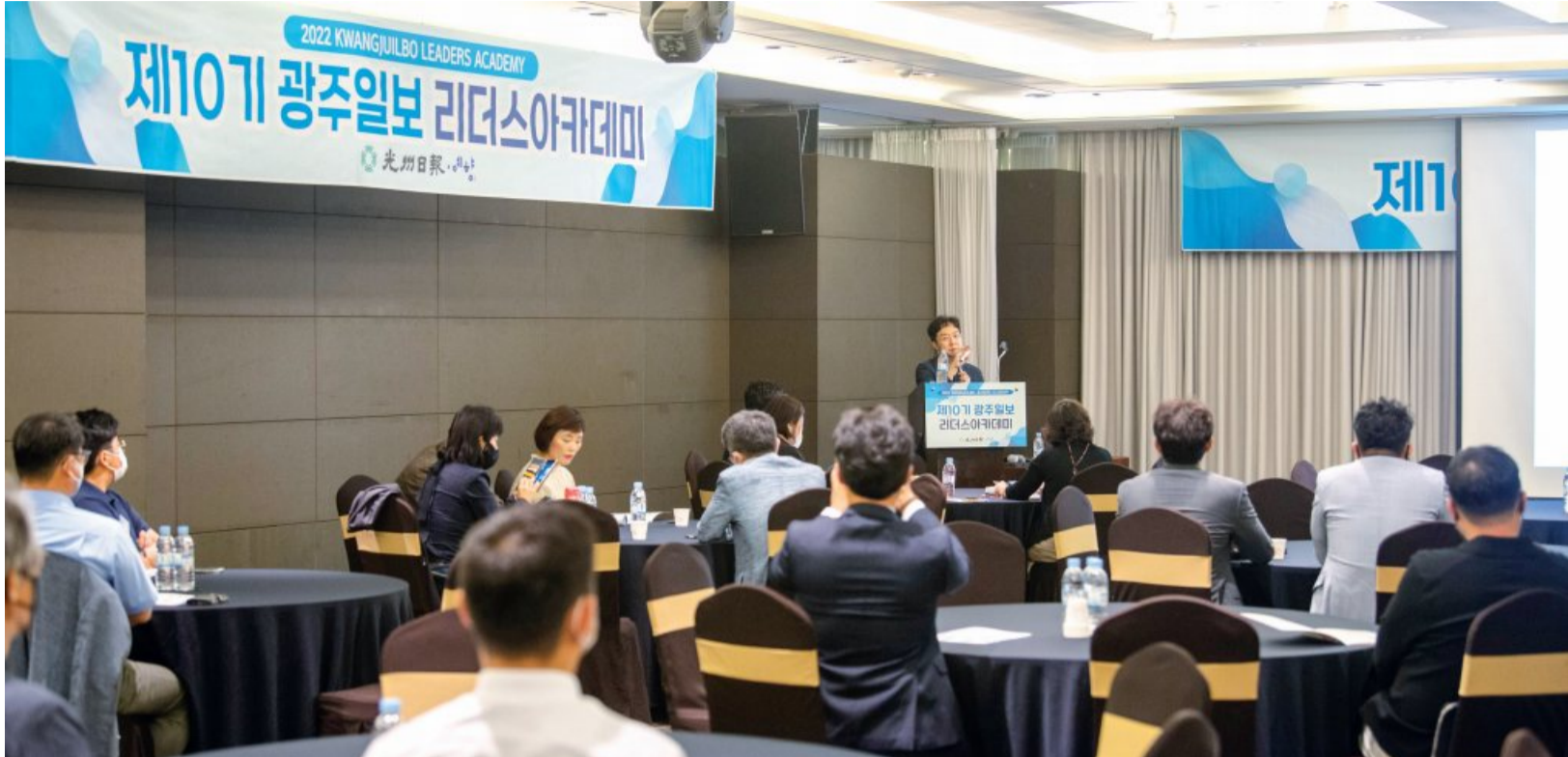
유현준 건축가가 지난 6일 광주시 서구 라마다플라자 광주호텔에서 열린 ‘광주일보 리더스 아카데미’에서 메타버스 공간에 대해 강의하고 있다.

한 예로 일정한 요금을 지불하고 10만 평 되는 땅을 몇 시간 동안 쓰는 골프에 대해 얘기했다. 공이 200m 날아가면 마치 그 공간이 모두 내 것처럼 느끼기 때문에 기분이 좋은 것이라는 설명이었다. 큰 돈을 주고 요트를 사는 것도 그와 같은 맥락이었다.