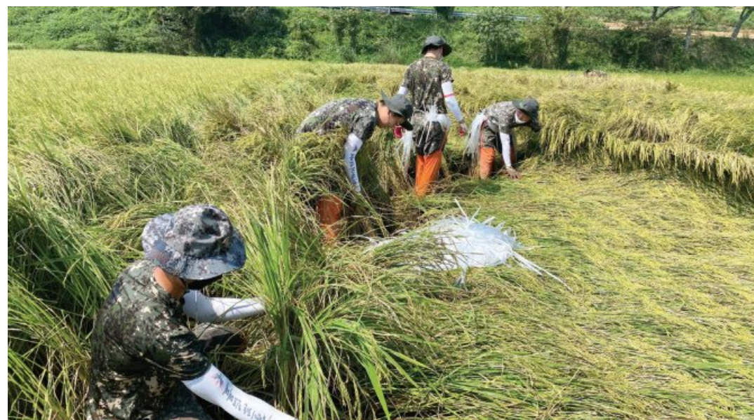
육군 31사단 장병 20여 명은 최근 태풍 피해를 입은 진도군 고군면 농가를 찾아 벼세우기 대민지원을 실시했다.